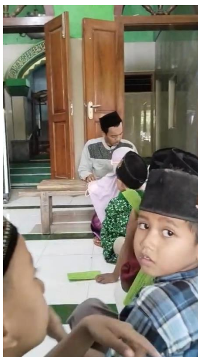
Gambar 4.7 Kegiatan Tes Kenaikan Jilid

Berdasarkan pengamatan peneliti, santri yang menjadi calon wisuda di TPQ Al-Huda Bonggah tidak hanya diuji kemampuan bacaan al-qur’annya, tetapi juga memiliki kewajiban menghafal kitab