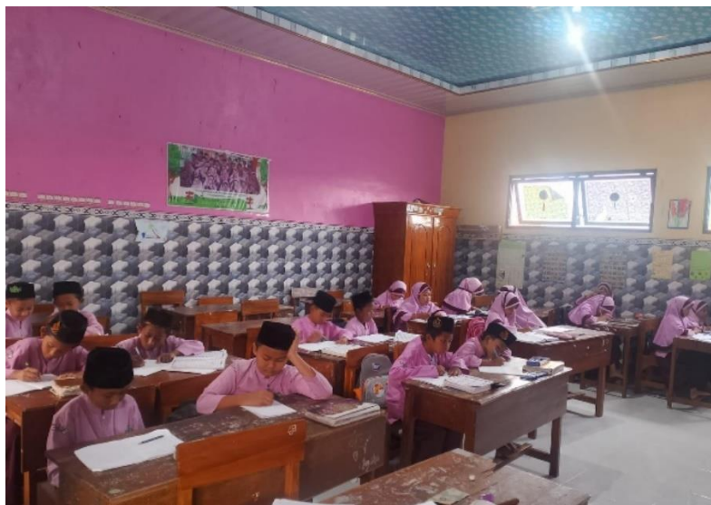
Gambar 4.1 Pembelajaran Di Kelas

Berdasarkan pengamatan peneliti di TPQ Al-Huda Bonggah, selain pembelajaran membaca al-qur'an, santri juga diberikan pembiasaan praktik ibadah sebagai bagian dari penguatan pemahaman keagamaan. Kegiatan ini dilakukan secara berkala agar santri tidak hanya memahami materi secara teori, tetapi juga mampu mempraktikkannya dalam kehidupan sehari-hari. Setiap bulan, santri yang sudah berada pada kelas al-qur'an dijadwalkan mengikuti kegiatan praktik wudhu dan sholat. Melalui kegiatan ini, santri dilatih untuk memahami tata cara wudhu dan sholat dengan benar, baik dari segi urutan, gerakan, maupun bacaan. Dengan adanya pembiasaan praktik tersebut, diharapkan santri tidak hanya mampu membaca al-qur'an dengan baik, tetapi juga memiliki keterampilan dalam melaksanakan ibadah secara tepat. 72 Terkait hal ini, Ustadz Ali