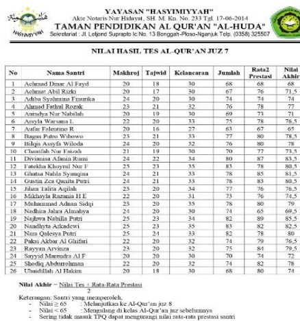
Gambar 4.10 Hasil Tes Kenaikan Juz

Berikut adalah dokumentasi hasil tes kenaikan jilid/juz metode al-nahdliyah di TPQ Al-Huda Bonggah: