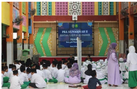
Gambar 4.9 Kegiatan Munaqosyah