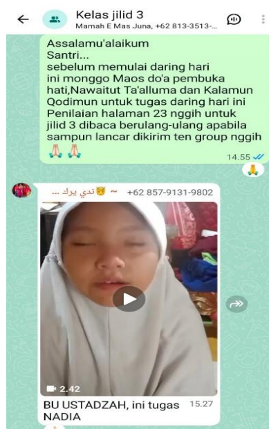
Gambar 4.6 Grub WhatsApp Kelas