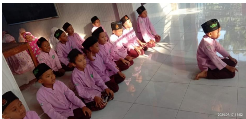
Gambar 4.2 Praktek Sholat

Berdasarkan pengamatan peneliti, pada saat kegiatan membaca secara individu, Ustadz atau Ustadzah melakukan penilaian langsung terhadap bacaan santri dan mencatatnya dalam kartu prestasi masing-masing. Kartu tersebut berisi catatan penilaian setiap harinya, sehingga menjadi alat pemantauan yang berkelanjutan. 74 Hal ini sesuai dengan yang disampaikan oleh Ustadzah Auliya Syifa bahwa kartu prestasi sangat membantu dalam mengetahui sejauh mana kemampuan santri berkembang, sekaligus menjadi bahan komunikasi