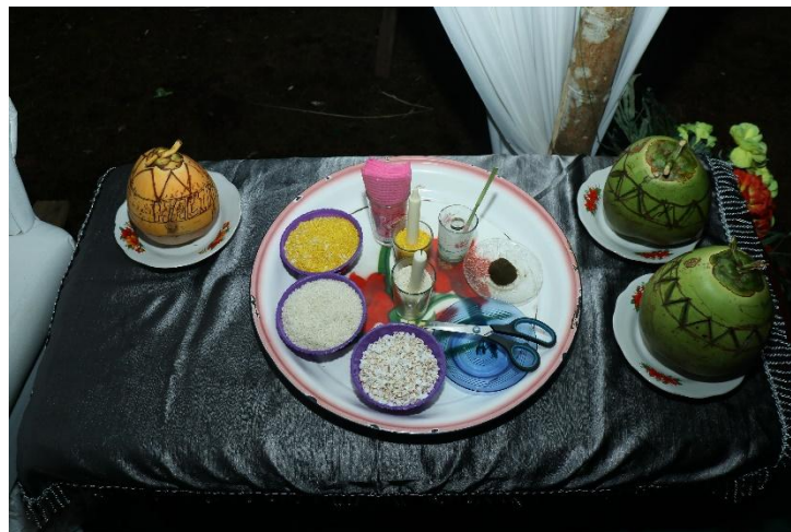
Dokumentasi Bahan dan perlengkapan yang digunakan pada prosesi Tradisi Tepuk Tepung Tawar Syukuran Kelahiran