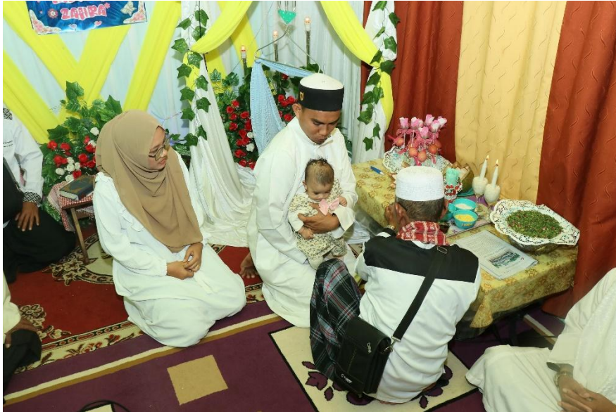
Dokumentasi Prosesi Tradisi Tepuk Tepung Tawar Syukuran Kelahiran