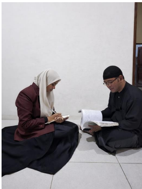
Wawancara Bersama Ustadz Jasmani