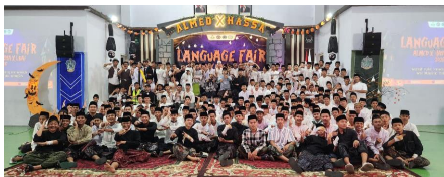
Santri Putra Al-Madienah Denanyar Jombang