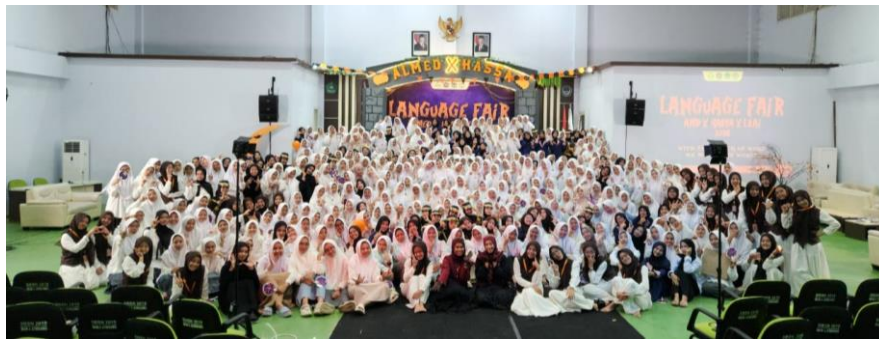
Santri Putri Al-Madienah Denanyar Jombang