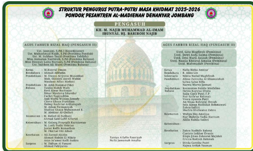
Struktur Pengurus Pesantren Al-Madienah Aliyah Putra dan Putri