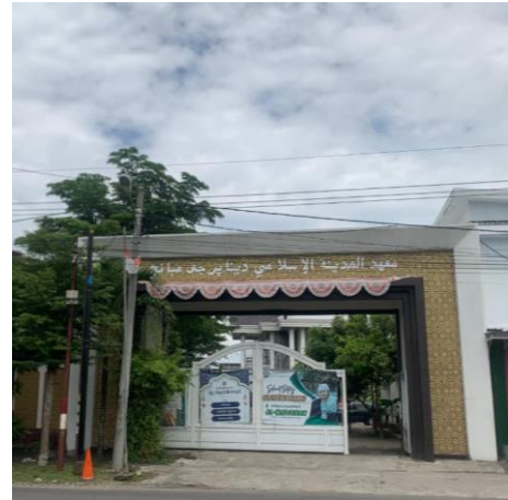
Foto Depan Pesantren Al- Madienah Denanyar Jombang