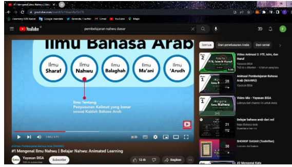
GAMBAR 2 تعلم النحو

يكون تعلم النحو أكثر تفاعلية عندما يحتوي الفيديو الذي يتم تشغيله على شرح على شكل رسوم متحركة أو حركة توضح الغرض من الشرح. هذه هي ميزة مقاطع فيديو اليوتيوب بحيث تبدو أكثر متعة ولا يكون لها انطباع بأنها طويلة جدًا أو قاسية.