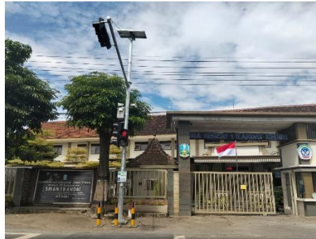
Dokumentasi lokasi penelitian SMA Negeri 1 Kandat