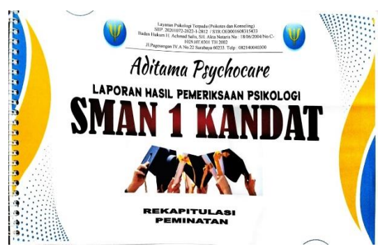
Dokumentasi sampul laporan hasil pemeriksaan psikologi peserta didik