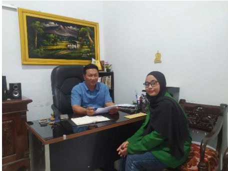
Dokumentasi dengan Ibu SR