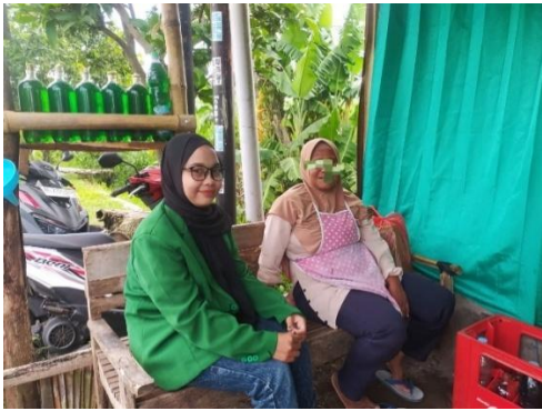
Dokumentasi dengan Ibu NH