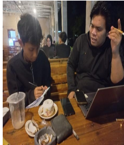
(Wawancara dengan saudara Adil)