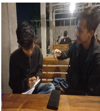
(Wawancara dengan saudara Harun)