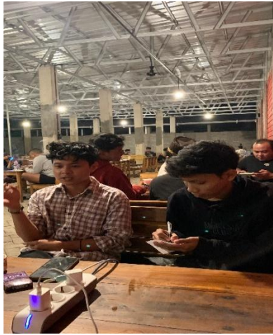
(Wawancara dengan saudara Yeye)