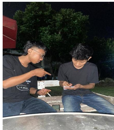
(Wawancara dengan saudara Imo)