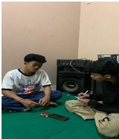
(Wawancara dengan saudara Rio)