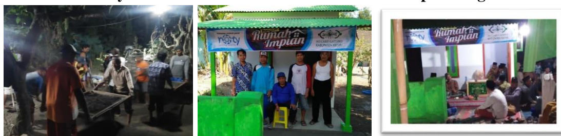
Gambar 4. 4 Penyaluran ZISWAF untuk bedah rumah dan pembangunan madin

Gambar 4.4 menjelaskan bahwa pentasyarufan pendanaan bedah rumah dan membangun madin berdasarkan kriteria yang sudah disepakati bersama oleh pengurus serta masyarakat sebagai bentuk pentasyarufan ZISWAF yang sesuai dengan visi-misi LAZISNU Kecamatan Kras. Setiap usulan penerima dan program pentasyarufan diputuskan melalui musyawarah antara pengurus dan masyarakat agar keputusan yang diambil transparan dan demokratis. Ahmad menjelaskan bahwa,