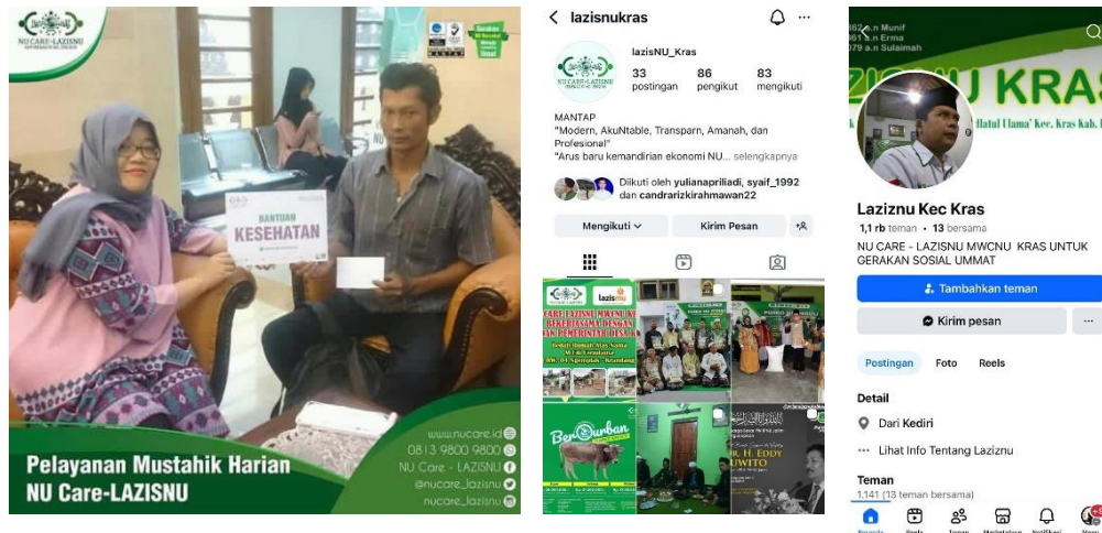
Gambar 4. 7 Konten Media Sosial LAZISNU Kecamatan Kras

Gambar 4.7 menjelaskan bahwa LAZISNU Kecamatan Kras telah memanfaatkan media sosial sebagai sarana pelaporan pentasyarufan dana ZISWAF. Namun dalam pemantauan peneliti masih belum optimal karena postingan terakhir hanya pada tahun 2024. Selain itu pelaporan jumlah dana penghimpunan belum ada sebagai sarana transparansi penghimpunan dan pentasyarufan ZISWAF. Pengaduan dari donatur bisa dilakukan lewat kontak yang tersedia walau selama ini sangat jarang terjadi keluhan. "Pengaduan bisa melalui kontak person di media sosial maupun banner. Selama ini, insyaAllah belum ada komplain dari donatur, kami benar-benar bertanggung jawab terhadap tugas kami." 73 Tuttur pak Munip menjelaskan terkait cara pengaduan dari para donatur maupun masyarakat luas.