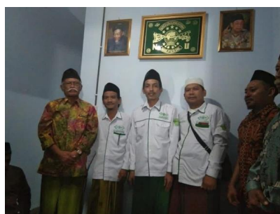
Gambar 4. 5 Musyawarah pengurus dengan masyarakat serta MWC NU Kecamatan Kras

Gambar 4.5 ini merupakan kegiatan pengurus LAZISNU Kecamatan Kras mengadakan rapat bersama Majelis Wakil Cabang Nahdlatul Ulama Kecamatan