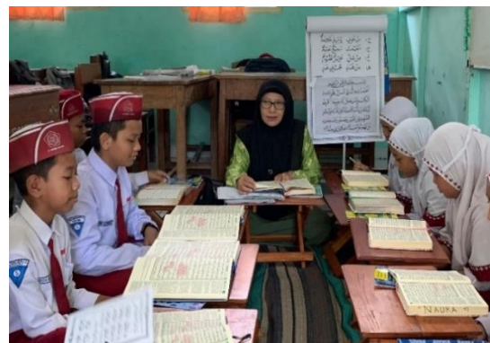
Dokumentasi pemahaman konsep metode Ummi