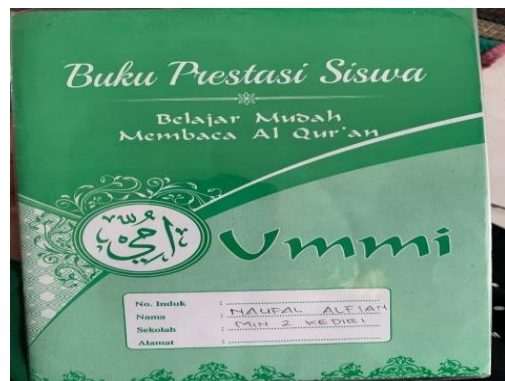
Dokumentasi Buku Prestasi Siswa