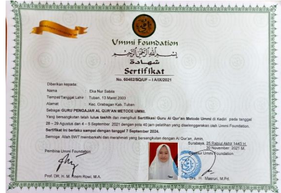
Dokumentasi Sertifikat Ummi