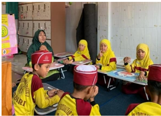
Dokumentasi Pembukaan Metode Ummi