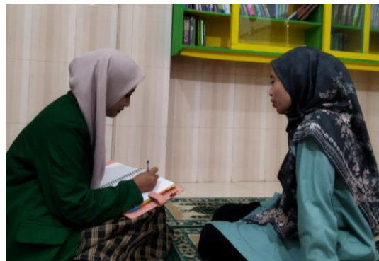
Wawancara Ustadzah Sabila