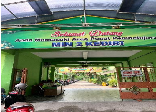
Dokumentasi MIN 2 Kediri