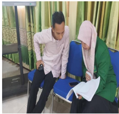
Wawancara Waka Kurikulum