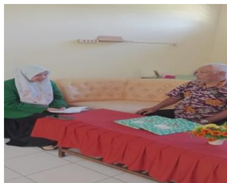
Wawancara Tim Supervisi