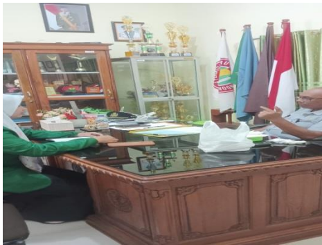
Wawancara Kepala Sekolah