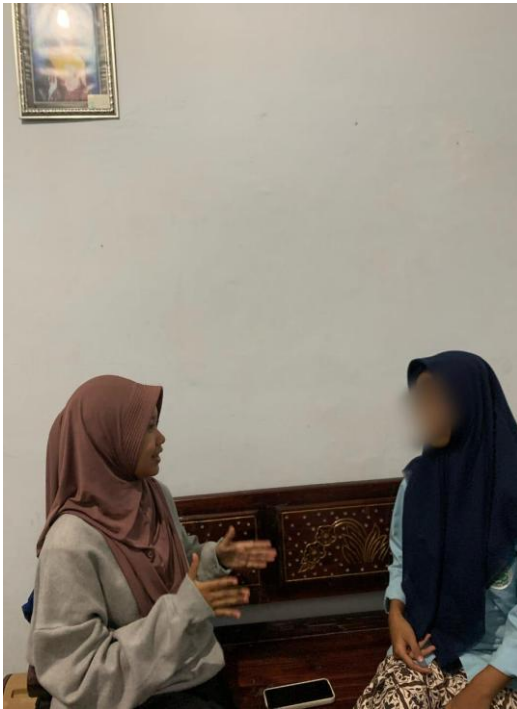
Dokumentasi Wawancara Dengan Informan SA