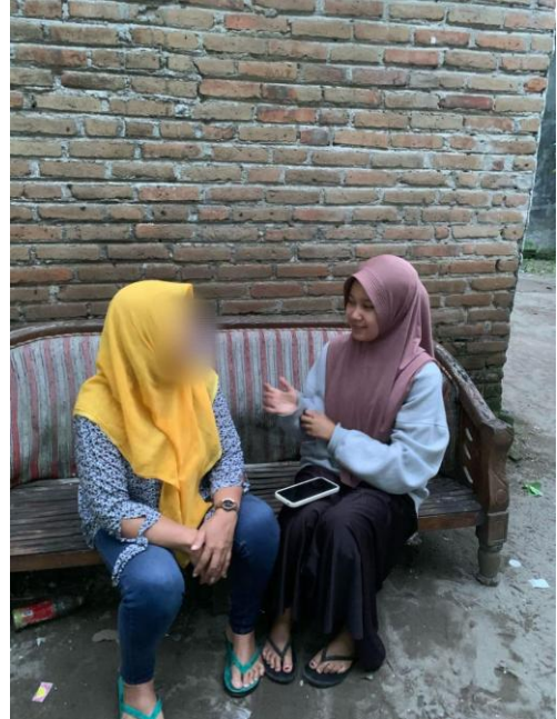
Dokumentasi Wawancara Informan TA