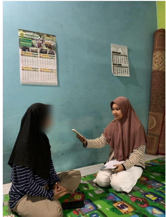
Dokumentasi Wawancara Dengan Informan DA