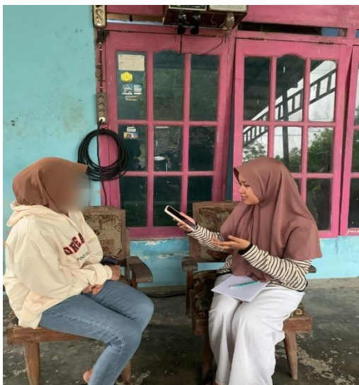
Dokumentasi Wawancara Dengan Informan AS