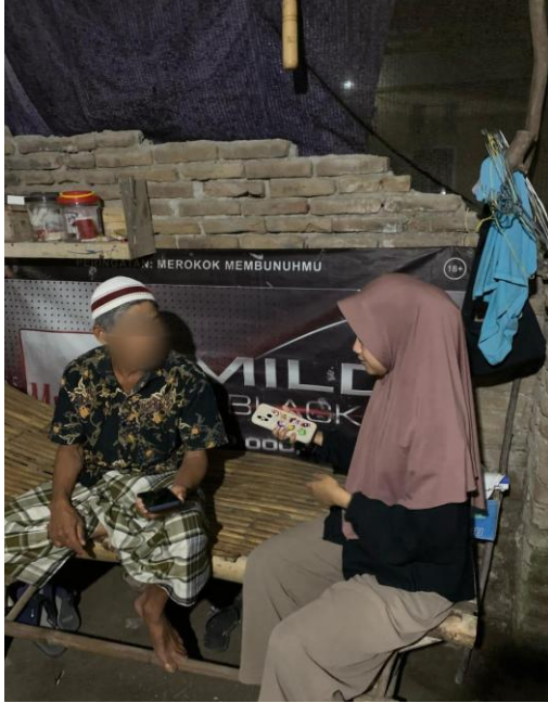
Dokumentasi Wawancara Dengan Informan Pak YI