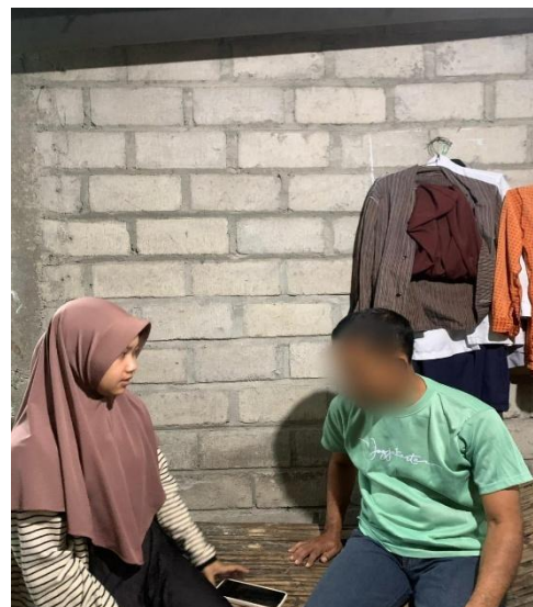
Dokumentasi Wawancara Dengan Informan LA