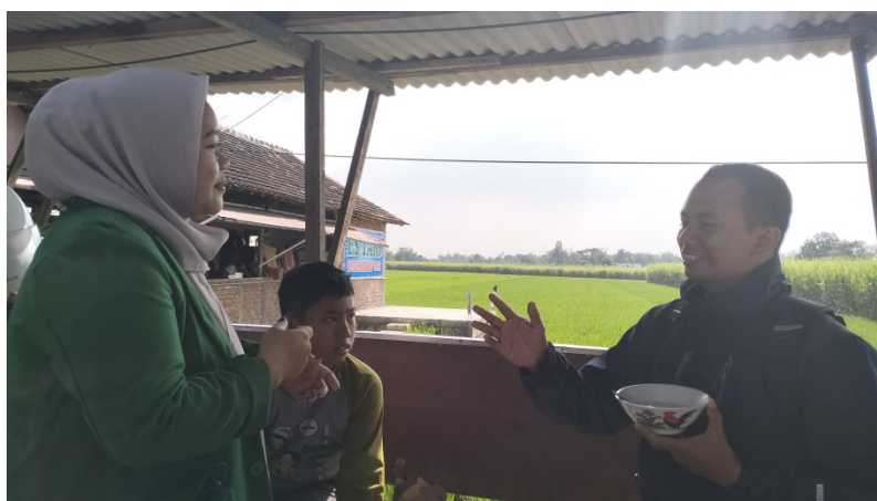
Gambar 6,7,8 : Wawancara Dengan Pelanggan Es Tari