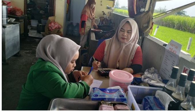
Gambar 5 : Wawancara Dengan salah satu pegawai Es Tari