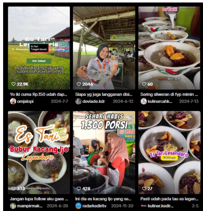
Gambar 12: Review Food Vloger Pada Tiktok