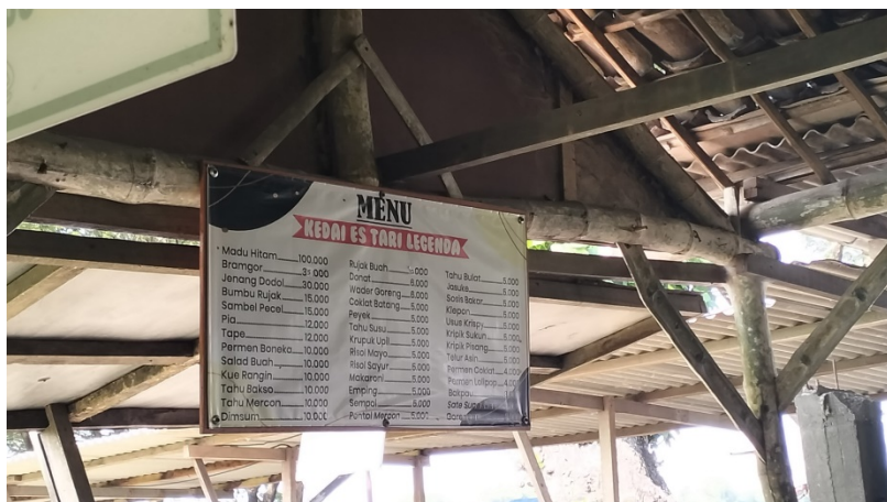
Gambar 10: Daftar Menu Es Tari Legendaris