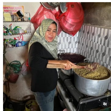
Gambar 3: Aktivitas Sebelum buka memasak Kedai Es Tari