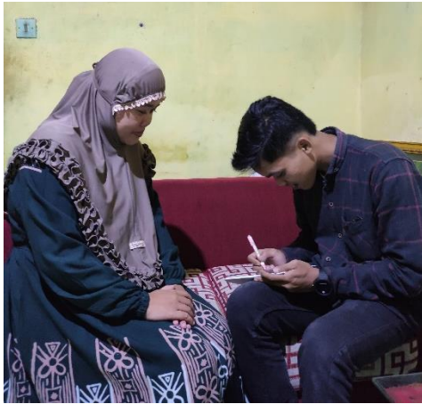
Wawancara Bersama Wali Murid