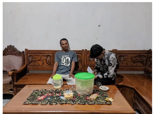
Wawancara Bersama Wali Murid