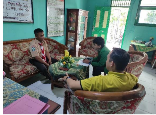
Wawancara Bersama Waka Sekolah