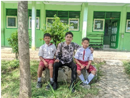
Wawancara Bersama Siswa Kelas VI