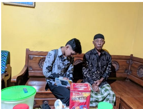
Wawancara Bersama Wali Murid