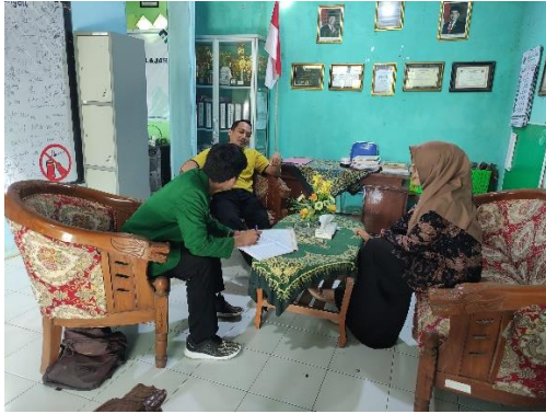
Wawancara Bersama Kepala Sekolah