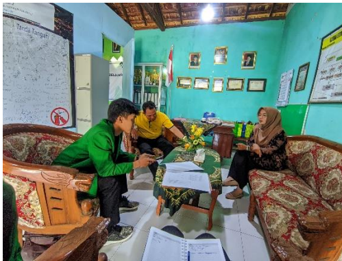
Wawancara Bersama Guru PAI Kelas VI