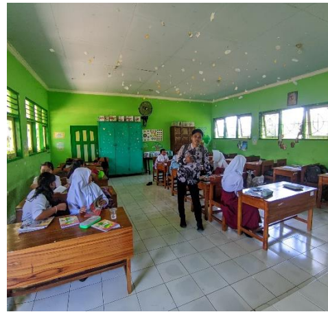
Wawancara Berswa Siswa Kelas VI