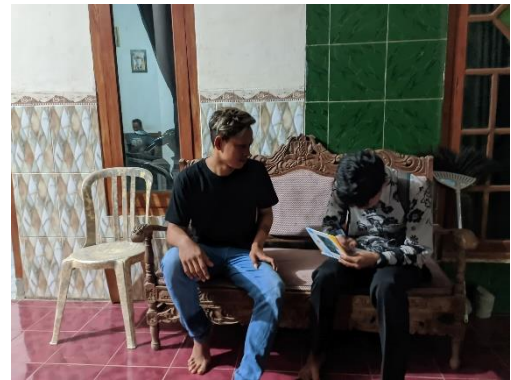
Wawancara Bersana Wali Murid