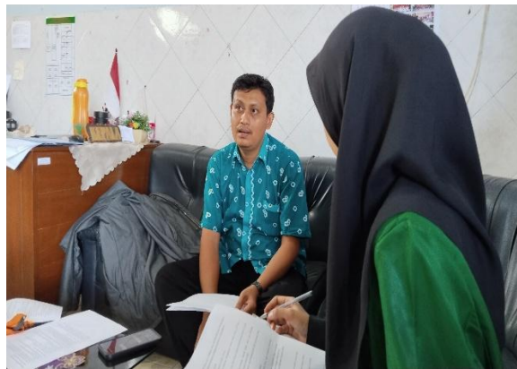
Gambar 2.3 Kegiatan Wawancara Dengan Waka Kesiswaan