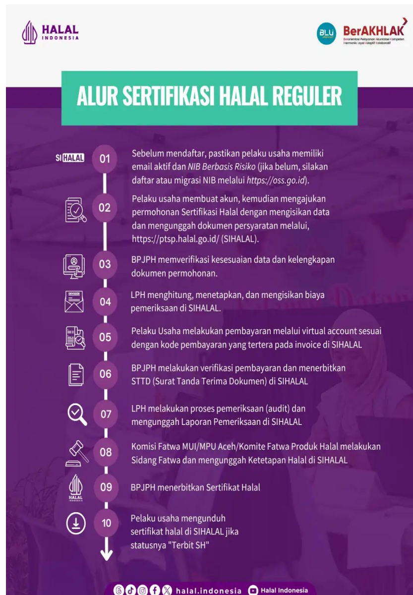
Gambar 2. 2 Alur Sertifikasi Halal Reguler