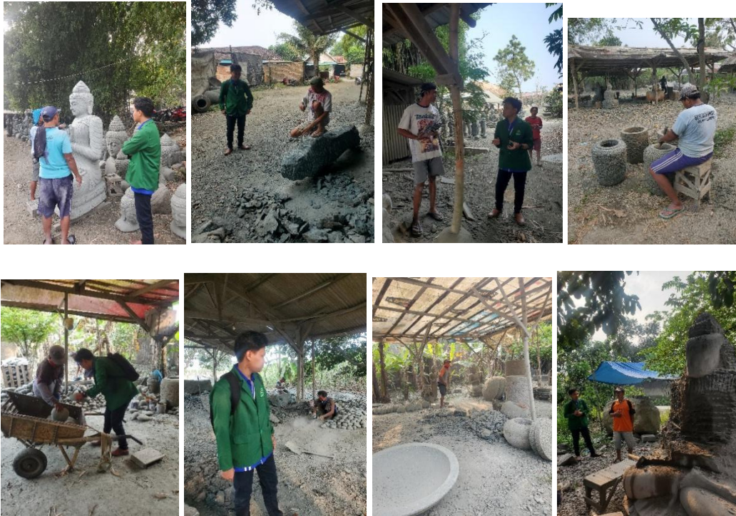
Gambar 4 (Contoh Produk UD Agus Statue)