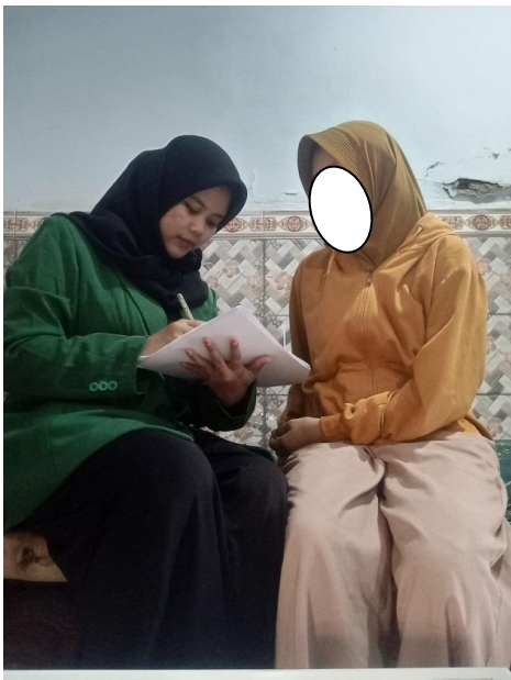
Wawancara dengan narasumber subjek 4