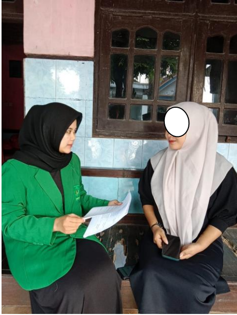
Wawancara dengan narasumber subjek 1