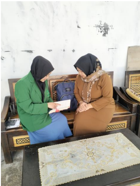
Wawancara dengan sekretaris desa