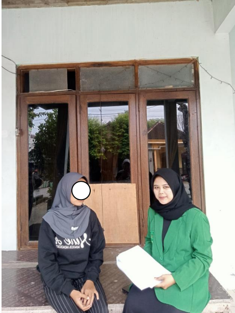
Wawancara dengan narasumber subjek 5