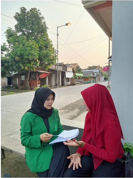
Wawancara dengan narasumber subjek 3