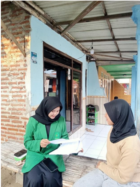
Wawancara dengan narasumber subjek 2