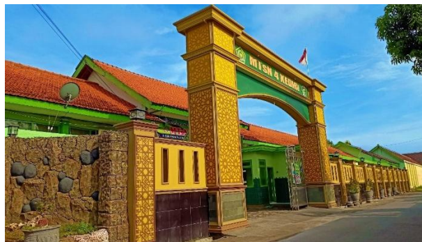
Gambar 4.1 Lokasi MTsN 4 Kediri