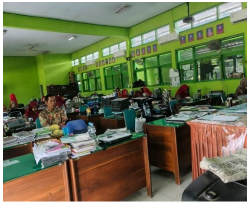
Gambar 4.2 Kondisi Ruang Guru MTsN 4 Kediri

Berdasarkan hasil wawancara yang dilakukan peneliti, peneliti melihat bahwa kepala sekolah sudah berusaha melaksanakan perannya dengan baik dalam memenuhi susunan kerja para guru di sekolah. Dengan menempatkan para guru sesuai bidang masing-masing, dan memenuhi sarana prasarana yang dibutuhkan guru atau pegawai dengan tujuan kenyamanan kinerja. Terbukti dari pengamatan peneliti bahwa susunan kerja dan fasilitas kerja di sekolah memberikan kenyamanan dan sesuai dengan kebutuhan para guru.