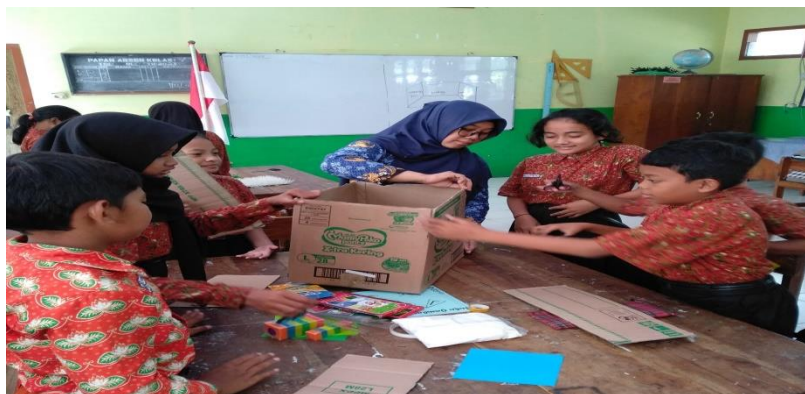
Kegiatan Proyek di Kelas V