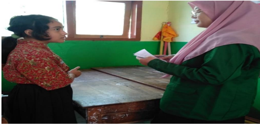
Wawancara dengan Akbela Siswa Kelas V