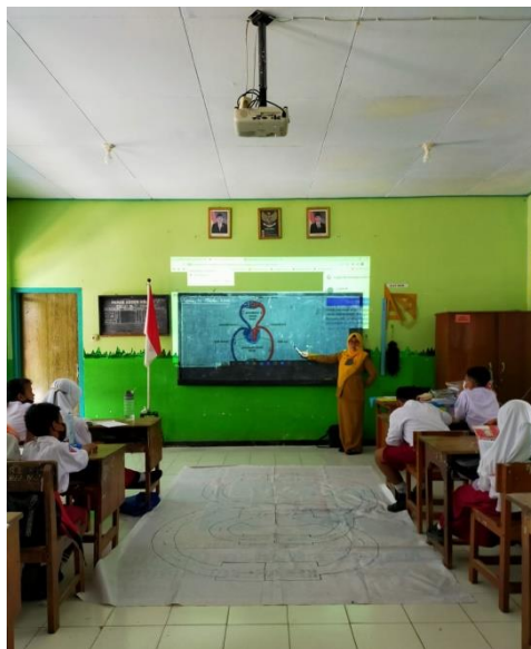
Guru Menjelaskan Materi