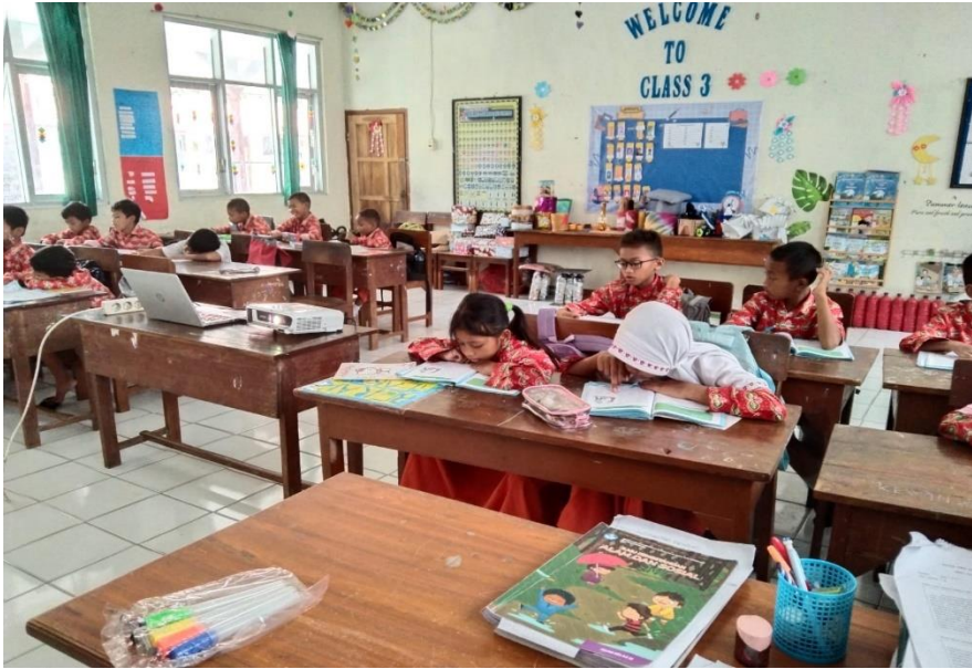
( proses Siswa belajar pendidikan pancasila berupa materi)