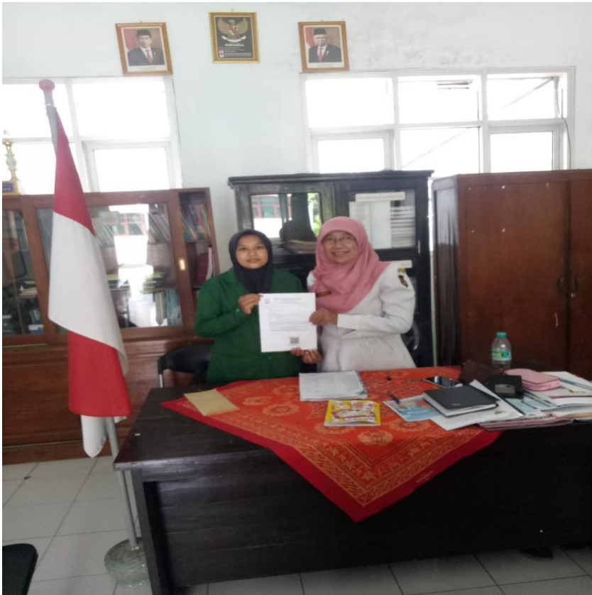
( foto penyerahan surat izin penelitian di sdn N gronggo 3 Kota Kediri)