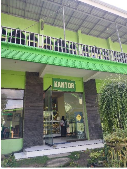
مكتب المدرسة المتوسطة الإسلامية روضة الطلابة