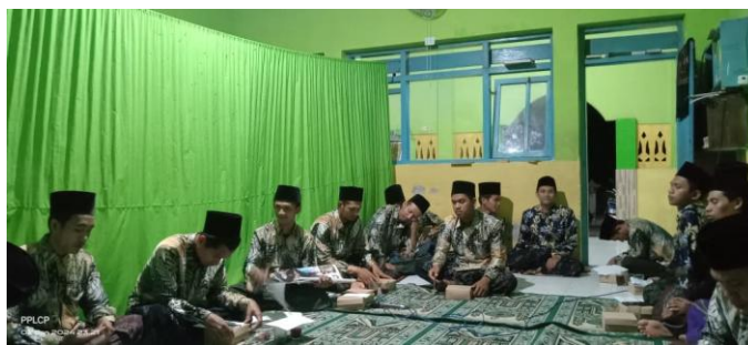
Gambar 4. 1 Musyawarah Kiai dan Pengurus

Penetapan tujuan nilai budaya santri tersebut kemudian disampaikan dan diselaraskan bersama pengurus pondok melalui musyawarah sebagai bagian dari proses perencanaan kepemimpinan pesantren. Musyawarah ini digunakan sebagai sarana penyampaian arah pembinaan agar tujuan yang telah ditetapkan dapat dipahami dan dijalankan bersama oleh pengurus.