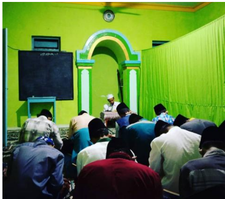
Gambar 4. 5 Kegiatan Diniyah

“mulai dari bangun tidur itu mas, rata-rata lare-lare itu langsung bersih-bersih. Setelah solat subuh berjamaah dilanjut dzikiran dan doa, kemudian ada sorogan Al-Qur’an. Habis itu sekitar jam 7 pagi ada kegiatan wajib belajar, setelah itu jam set 9an sampai jam 2 itu jam kosong biasanya diisi dengan lalaran nadhom, hafalan, belajar lagi, tergantung pribadi santrinya sih mas pas jam kosong mau ngapain. Setelah itu jam 2 solat dzuhur, terus jam setengah 3 itu diniyah jam pertama, habis itu jam 4 kurang itu solat ashar, setelah solat ashar itu diniyah lagi jam kedua. Setelah diniyah sambil menunggu maghrib itu biasanya lalaran nadhom atau murojaah pelajaran diniyah yang tadi. Setelah solat maghrib ada wajib belajar lagi mas sampai jam 9 habis itu solat isya, terus santri diperbolehkan untuk istirahat.” 94