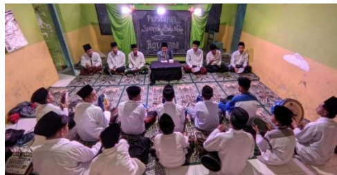
Gambar 4. 7 Pembinaan Santri Saat Penutupan Jami'iyah

Proses pembinaan santri tersebut juga didukung oleh kegiatan-kegiatan yang berlangsung secara rutin di lingkungan pesantren, sebagaimana terlihat pada dokumentasi kegiatan santri dalam mengikuti pembinaan dan kegiatan bersama di pesantren.