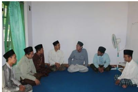
Gambar 4. 8 Kunjungan Dewan Harian Pusat

Selain itu, evaluasi eksternal juga terlihat melalui kunjungan Dewan Harian Pondok Lirboyo Pusat sebagaimana berikut.