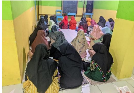
Gambar 4. 4 Kegiatan Wajib Belajar

“setelah sorogan ba’da maghrib, santri melanjutkan wajib belajar, intinya mengulang pelajaran sore sampai sekitar jam 9 sambil menunggu jamaah sholat Isya’. Untuk santri yang diniyah sore, malam hari tidak ada kelas, sehingga kegiatan malamnya fokus pada sorogan Qur’an dan murojaah kitab pelajaran.” 91