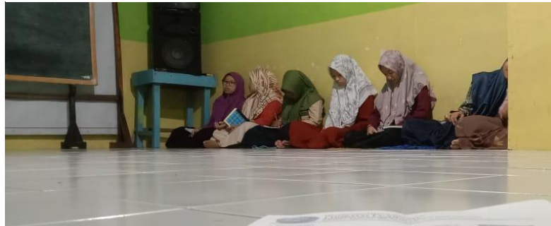
Gambar 4. 9 Musyawarah antar pengasuh & pengurus

Hal tersebut juga diperkuat dengan dokumentasi kegiatan musyawarah antara pengasuh dan pengurus sebagai bagian dari proses evaluasi kepemimpinan.