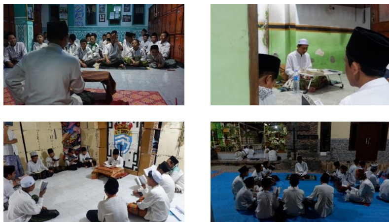
Gambar 4.1 Kegiatan Fashohah

Sistem perkelasan tahfidz di Pondok Pesantren Hamalatul