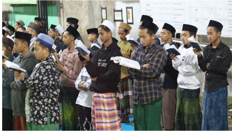
Gambar 4.6 Dhuha Dan Tahajjud Dengan Maqro' 1/2 Juz