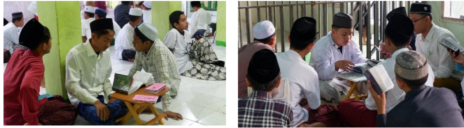
Gambar 4.4 Buku Setoran