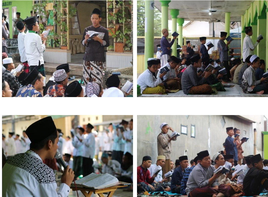
Gambar 5.5 Kegiatan 5 Juz An

keamanan, Banser Hq, dan diawasi langsung ketua pondok dan pengasuh, dimulai dari hari sabtu dan khatam hari kamis, 5 juz an ini dilaksakan secara konsisten dan istiqomah setiap hari pada jam 07.00-09.30.” 33