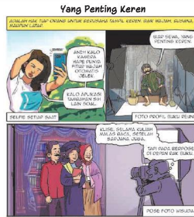
Gambar 2.1 Komik "Yang Penting Keren"

Pada bab ini kalian akan belajar memahami teks anekdot sebagai salah satu cara dalam menyampaikan kritik dan membuat teks eksposisi berdasarkan hasil penelitian untuk menyampaikan fakta yang terjadi sebagai bahan untuk menyampaikan kritik sosial. Mendiskusikan dan memahami definisi teks anekdot.