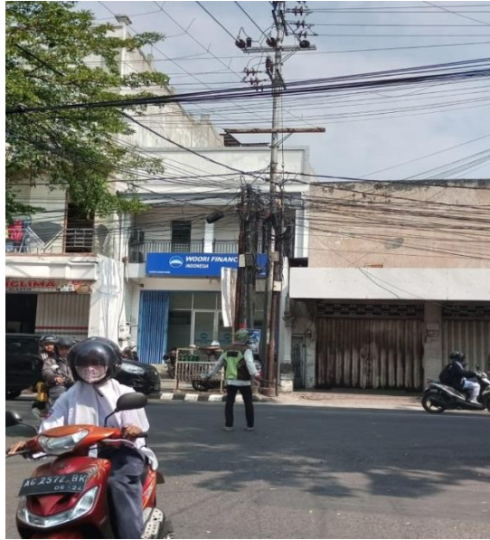
Gambar 1 Pak Ogah di Jalan Panglima Sudirman Kota Kediri