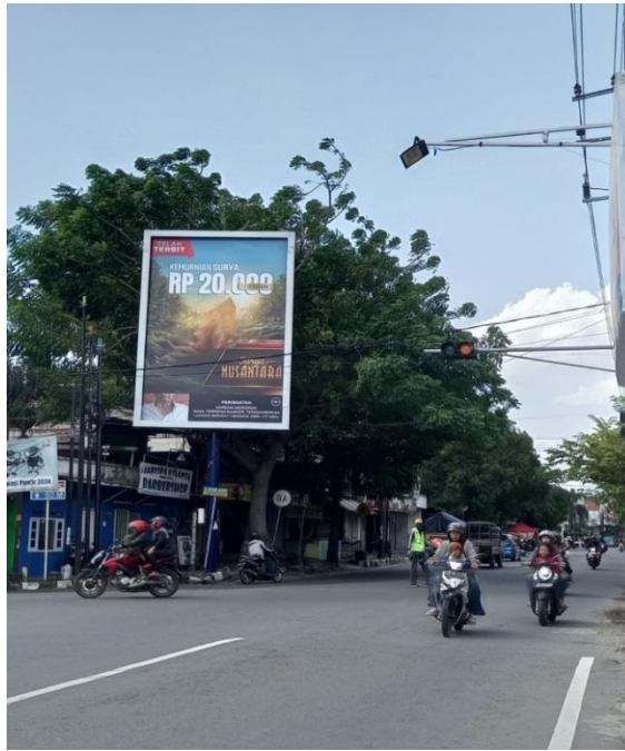
Gambar 5 Pak Ogah di Jalan HOS Cokroaminoto Kota Kediri