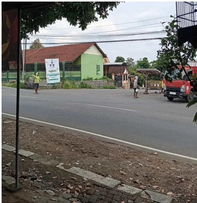
Gambar 6 Pak Ogah di Jalan Raung Kota Kediri