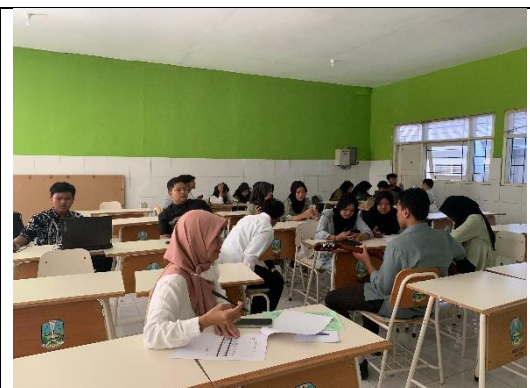
Koordinasi terkait Kegiatan P5