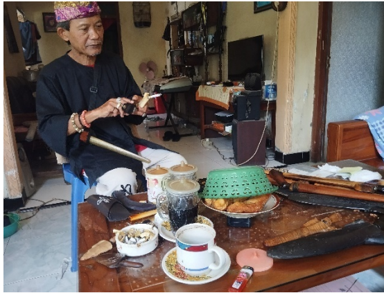
Wawancara Dengan B (Informan Tambahan)