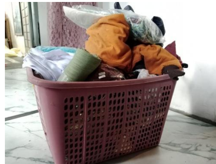
Barang Pesanan Yang Tidak Diambil Oleh Pelanggan