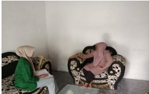
Wawancara Ibu AR (Pemilik Usaha Jasa Tailor AR)