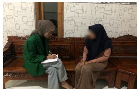
Wawancara Konsumen KA