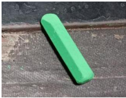
Crayon Untuk Menggambar Pola Dikain