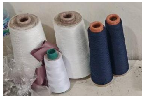
Benang Obras Polyester