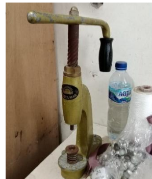
Alat Press Pembuat Kancing Bungkus