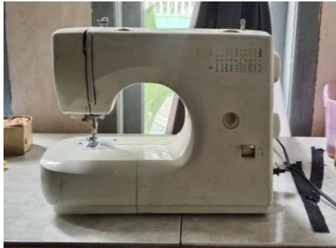
Mesin Jahit Portable Listrik