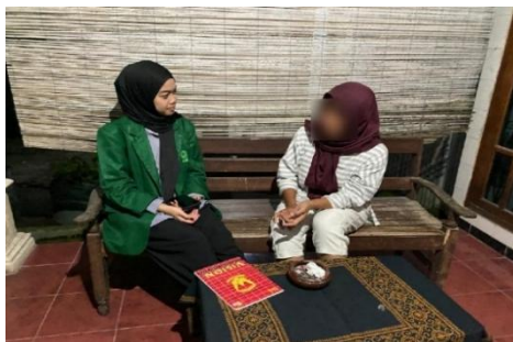
Wawancara Konsumen HI