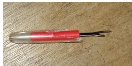
Alat Pendedel Benang