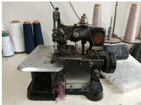
Mesin Jahit Obras