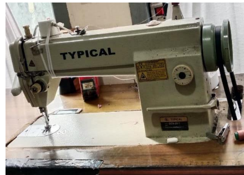
Mesin Jahit Typical