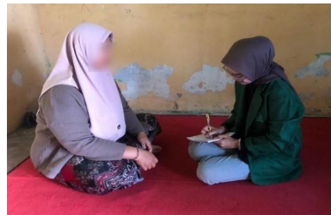
Wawancara Konsumen AI