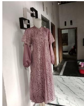
Hasil Jahitan Ibu AR