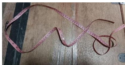
Alat Ukur Badan Kain