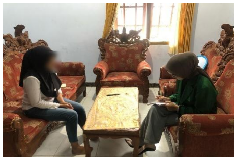
Wawancara Konsumen UL