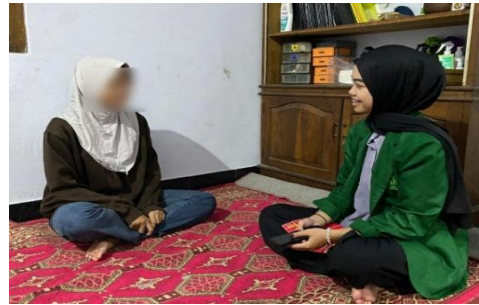
Wawancara Konsumen BR