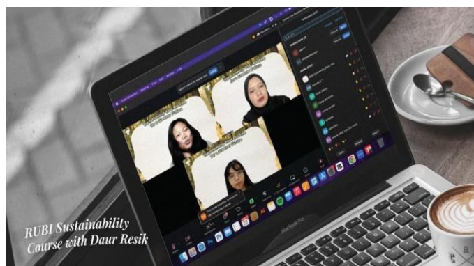
RUBI Course kollab dengan @dauresik