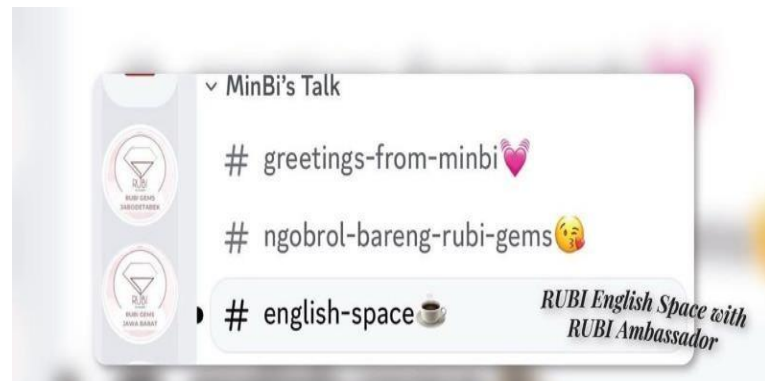
RUBI diskusi di platform Discord