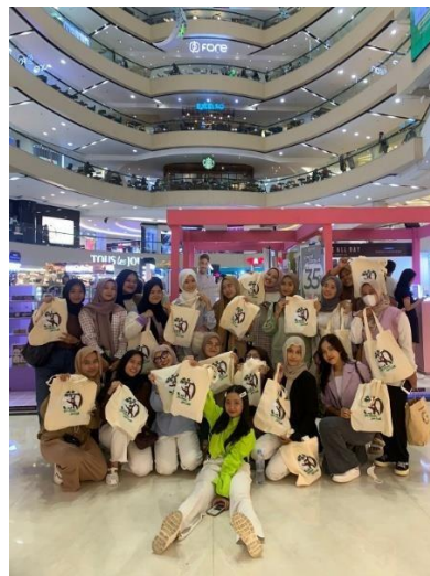
RUBI meet bersama anggota RUBI di Surabaya