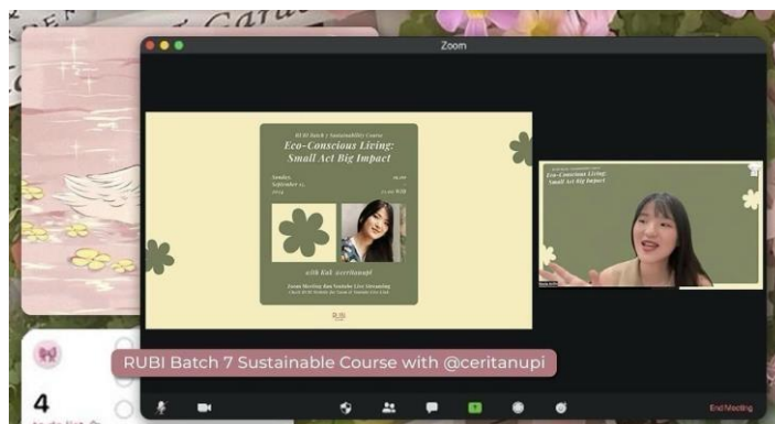
RUBI Course bersama kak @ceritanupi