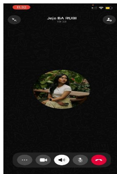
Wawancara dengan Jenry Ambassador RUBI Community