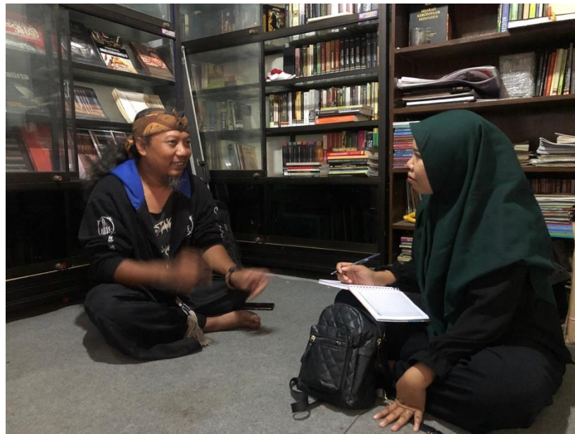
Gambar 5 Foto Bersama Pemerhati Budaya