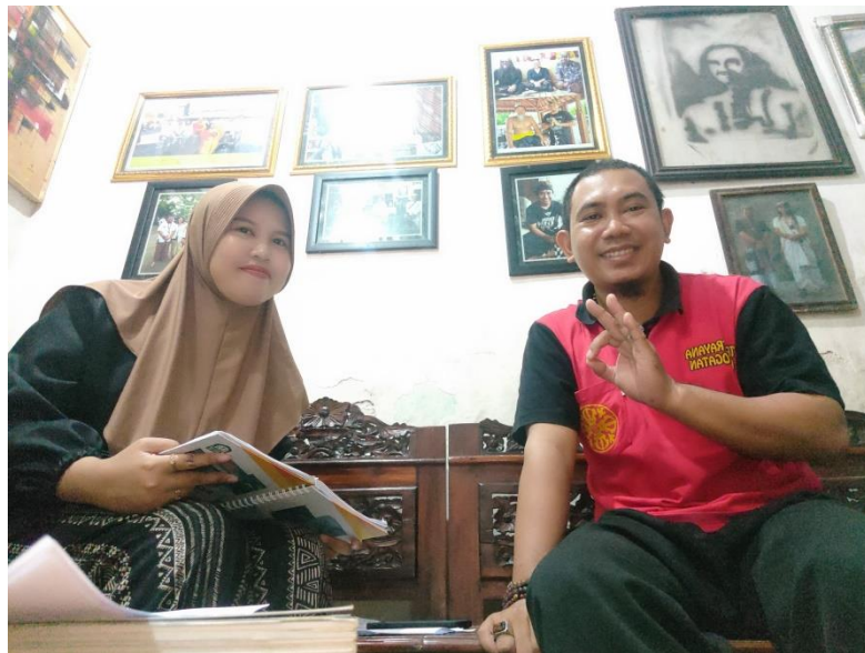
Gambar 4 Foto Bersama Wakil Pasak Kadhiri