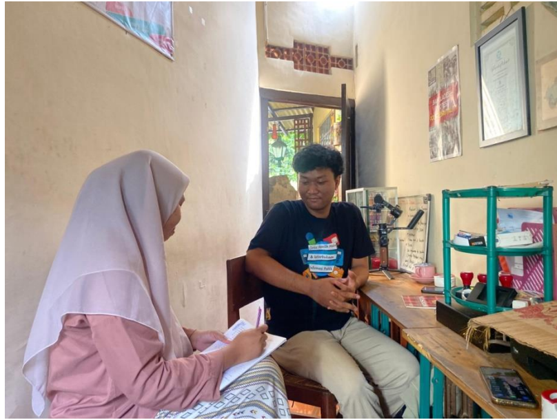
Gambar 3 Foto Bersama Reporter Kediripedia.Com