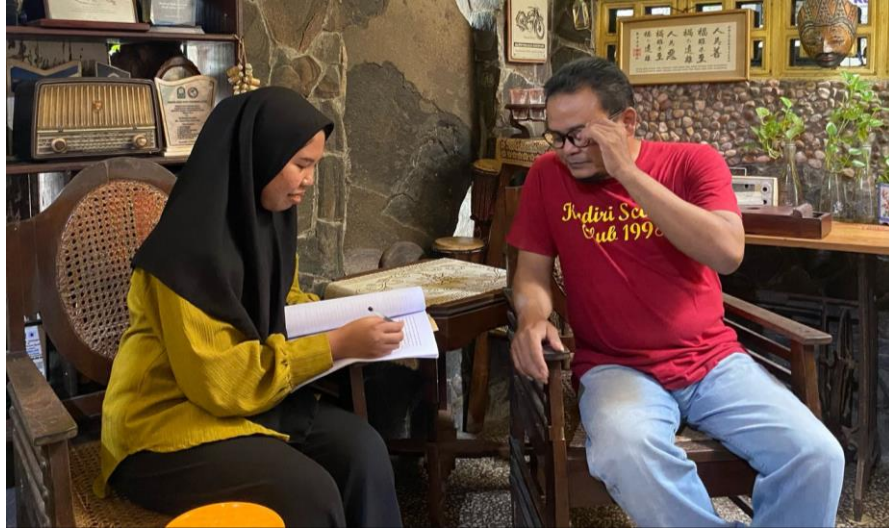
Gambar 1 Foto Bersama Pemimpin Redaksi Kediripedia.Com