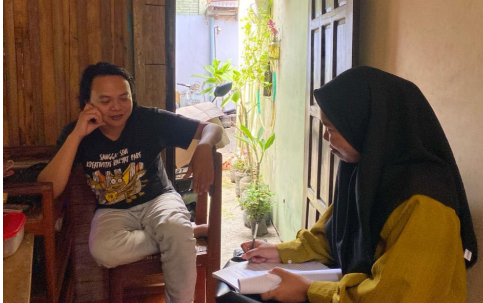
Gambar 2 Foto Bersama Redaktur Pelaksana Kediripedia.Com