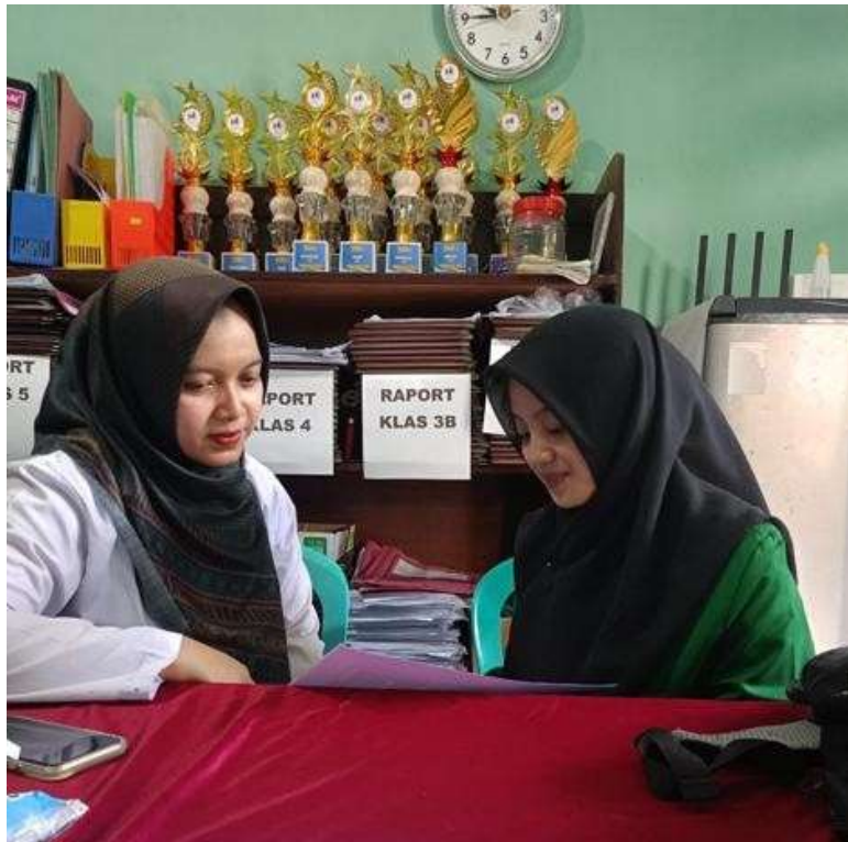
(Kegiatan wawancara dengan guru kelas IV)