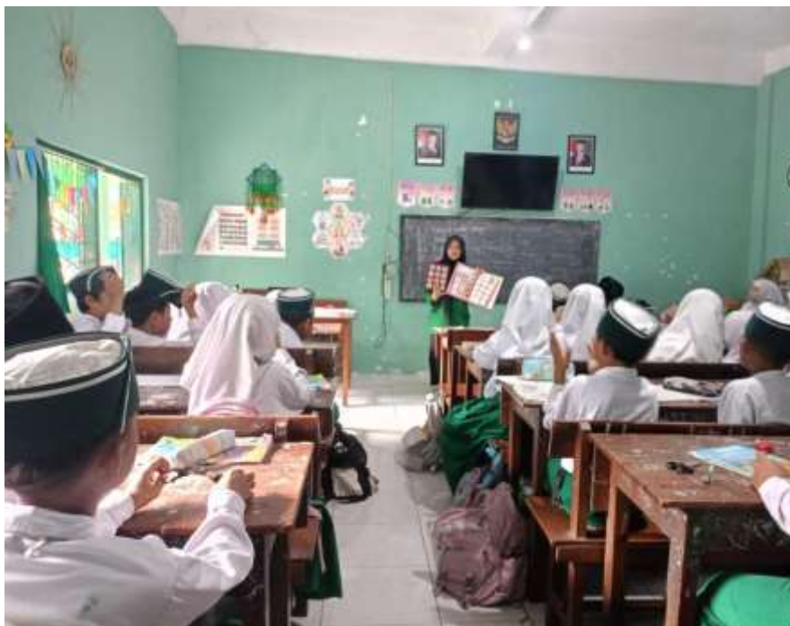
(Uji coba skala besar terhadap media Fun Thinkers Book )