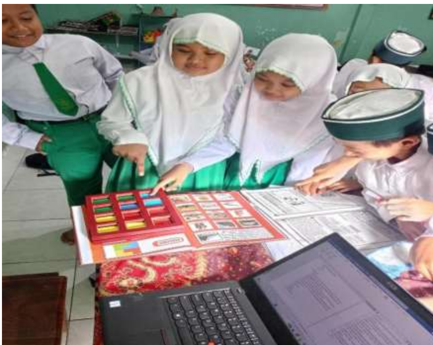
(Kegiatan peserta didik menggunakan media Fun Thinkers Book )