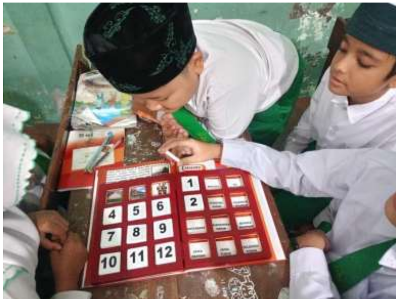
(Uji coba skala kecil terhadap media Fun Thinkers Book )