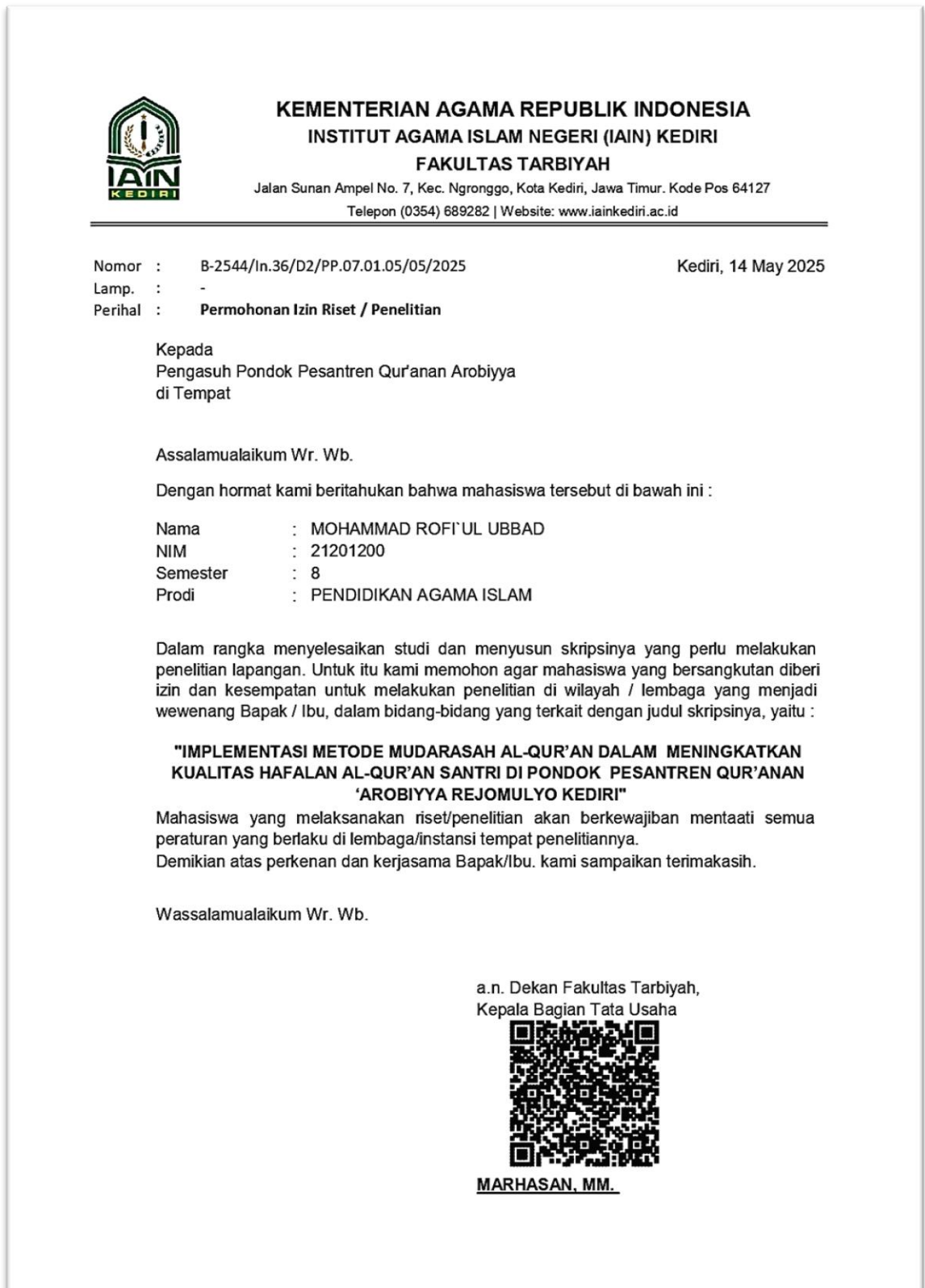
Gambar 8. 1 Surat Izin Observasi