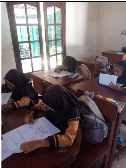
Uji kelayakan Kelompok Kecil