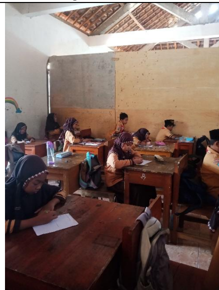
Angket Sesudah penggunaan media