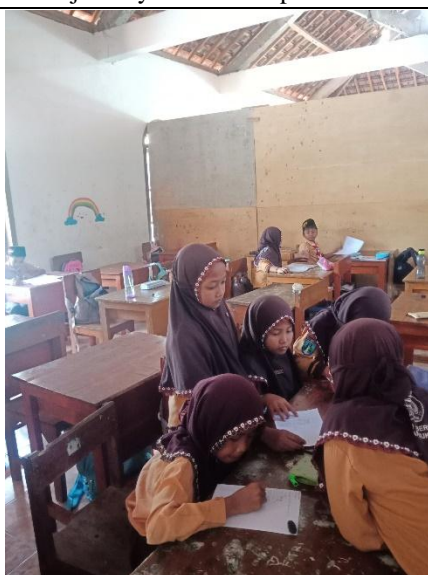
Angket Sebelum Penggunaan Media