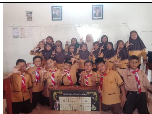
Dokumentasi Implementasi Media