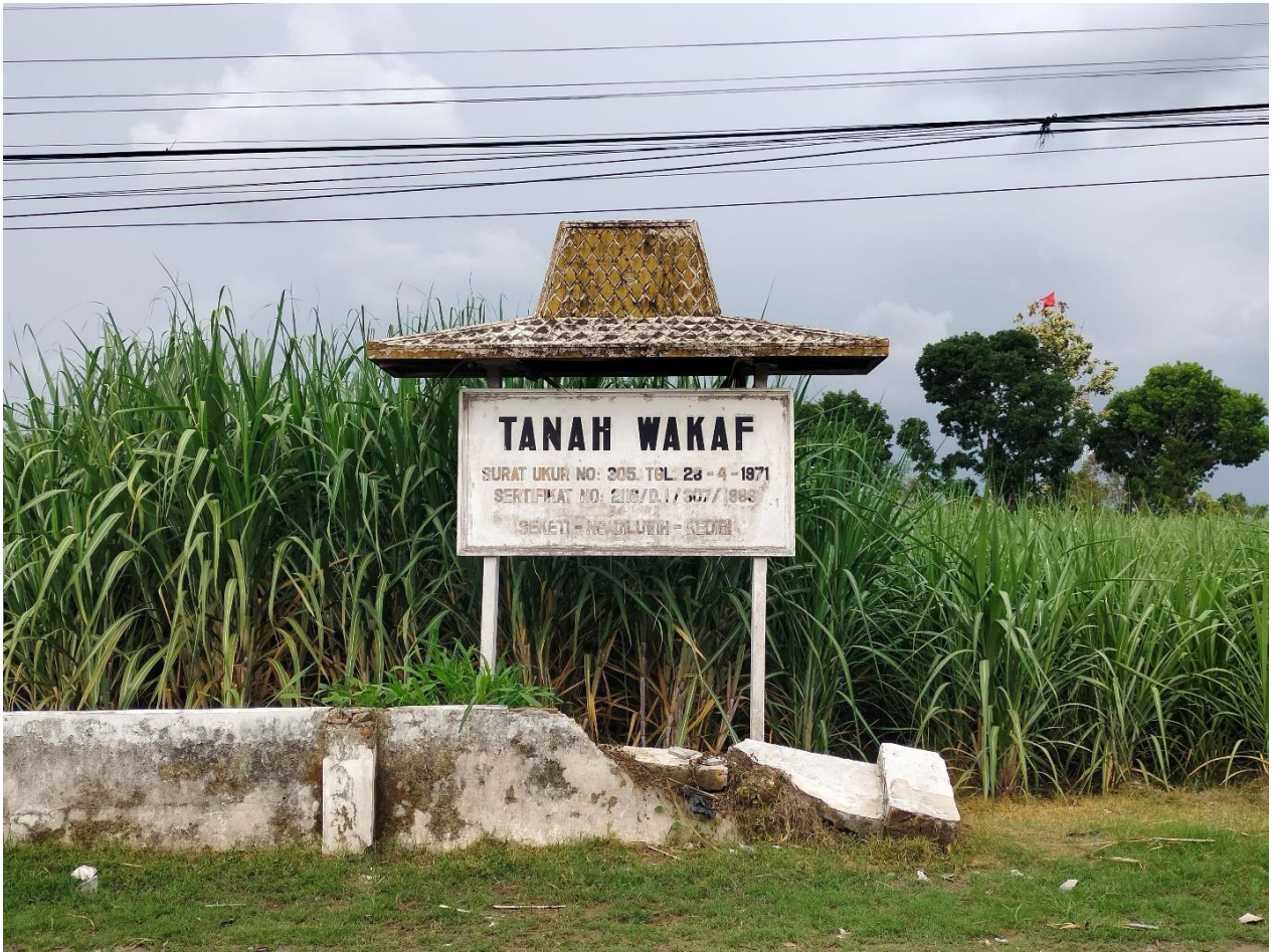
Tanah Wakaf Produktif di Desa Seketi