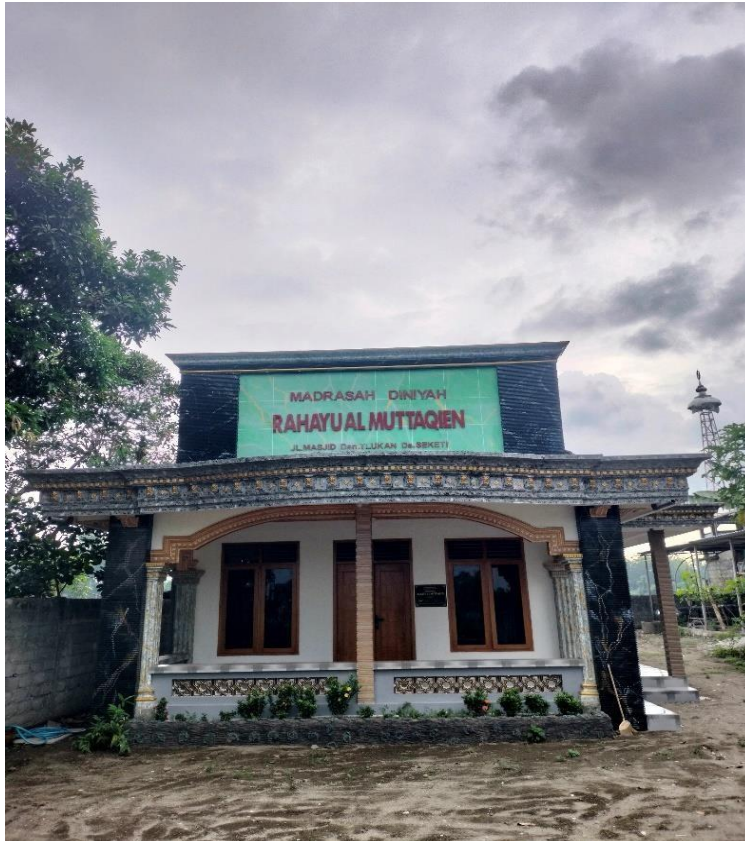
Madrasah Diniyah Rahayu Al-Muttaqien Dari Depan