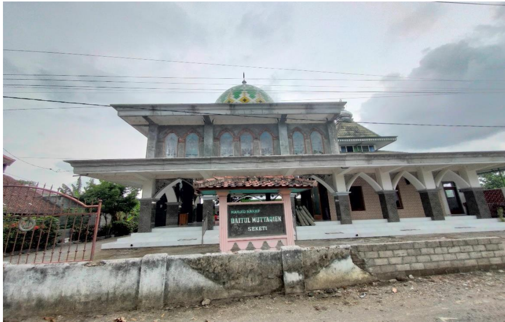
Masjid Baitul Muttaqin Dari Depan