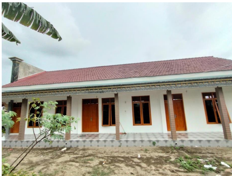
Madrasah Diniyah Rahayu Al-Muttaqien Dari Samping