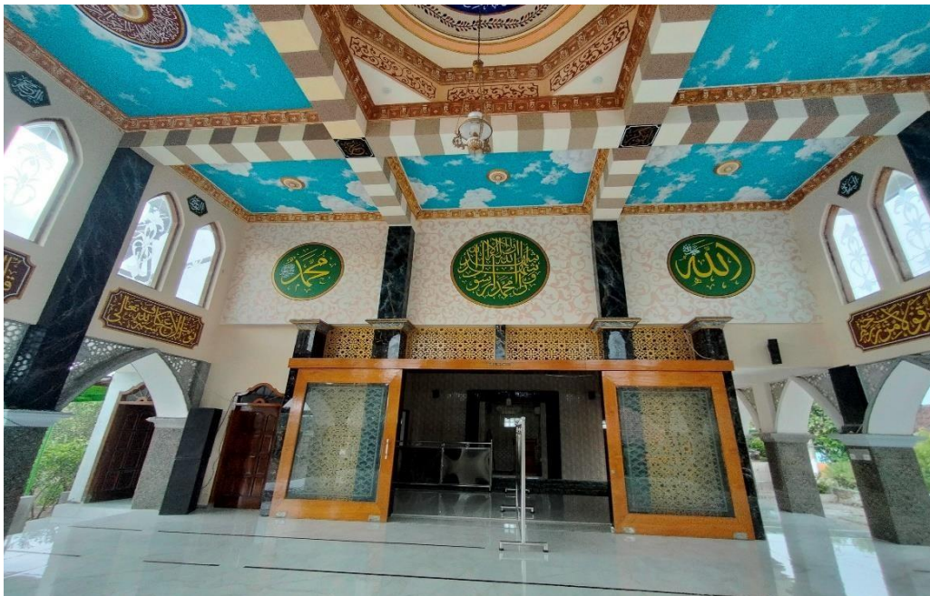
Masjid Baitul Muttaqin Dari Dalam