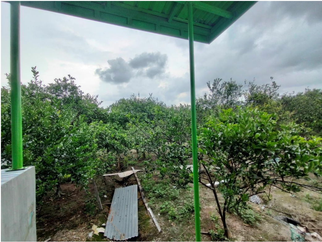
Lahan yang di Tanami Pohon Jeruk