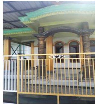
Musholla Darul Muttaqin