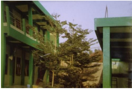
Gedung Mts dan MA