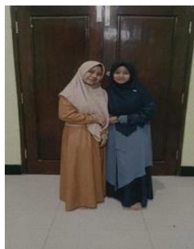
Wawancara dengan Santri