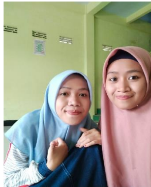
Wawancara dengan Santri