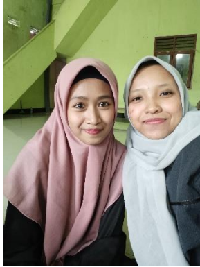
Wawancara dengan Ustadzah