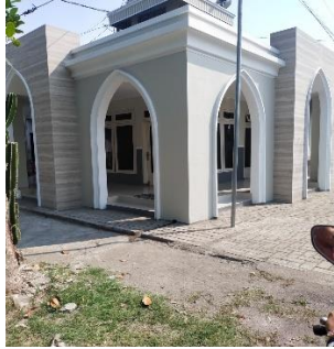
Musholla Nurul Yaqin