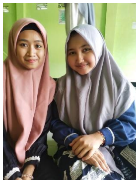
Wawancara dengan Pengurus