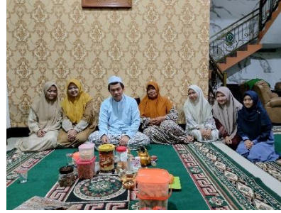
Sowan Ndalem Pengasuh beserta wawancara