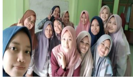
Wawancara Bersama Ustadzah-Ustadzah