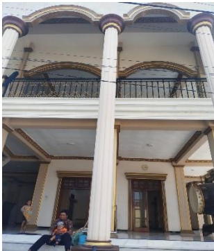
Masjid Baitul Mu'min