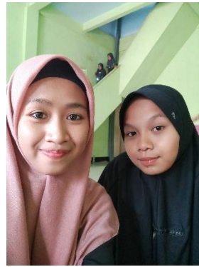
Wawancara dengan Santri