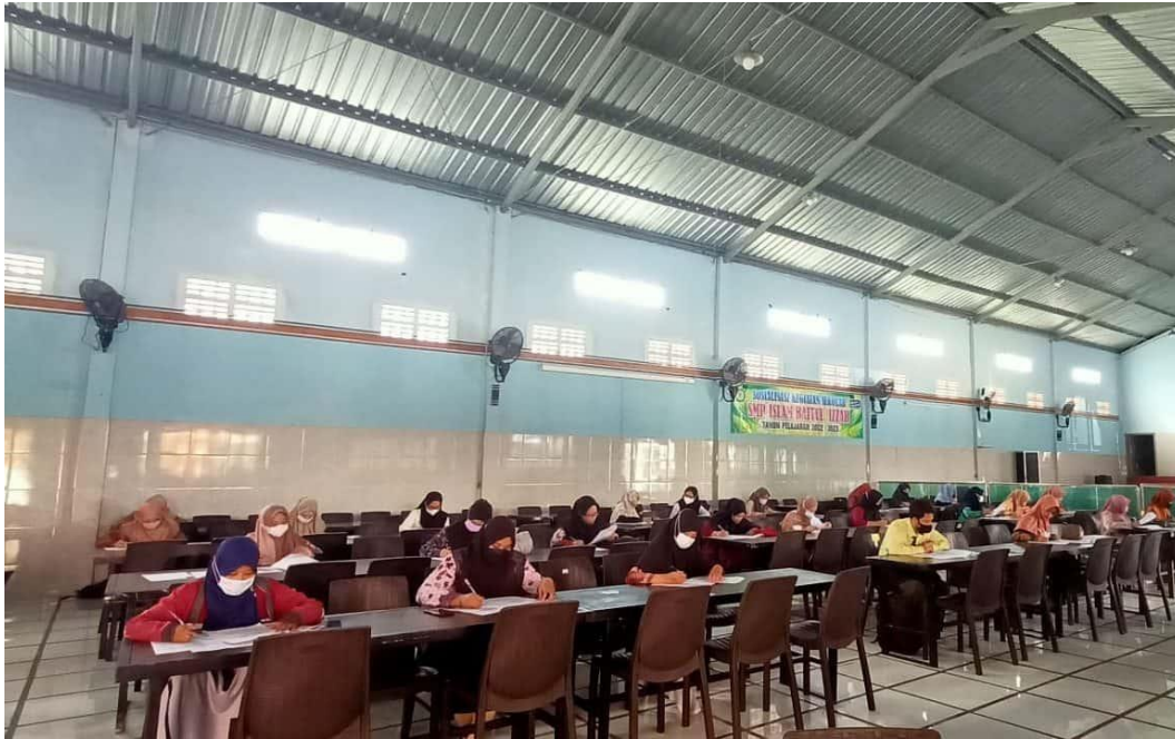
Lampiran 5 : Seleksi Tes Tulis