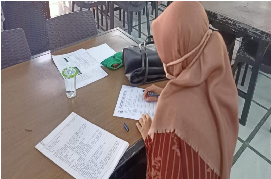
Lampiran :6 : Interview