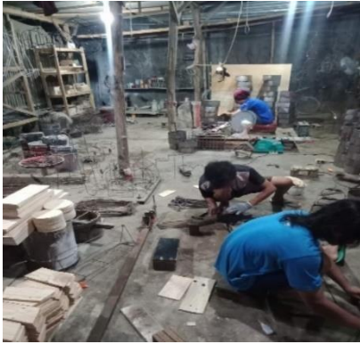
Gambar 8. 7 Proses pembuatan produk UMKM Yen Collection