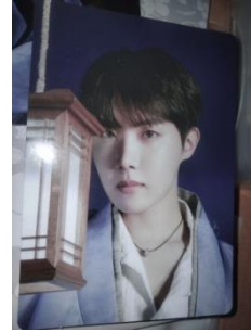
Merch milik JM