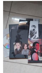
Merch milik S