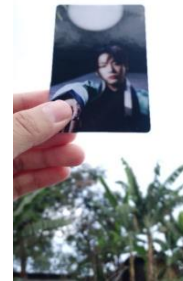
Merch milik L