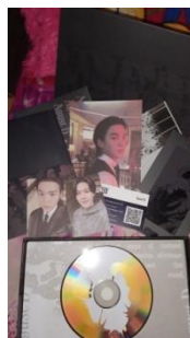
Merch milik D