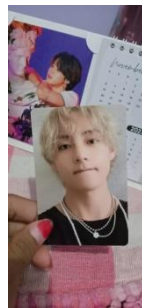
Merch milik MT