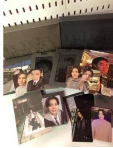
Merch milik M