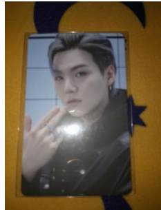
Merch milik A