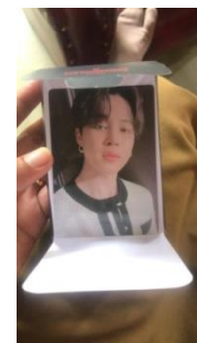
Merch milik R