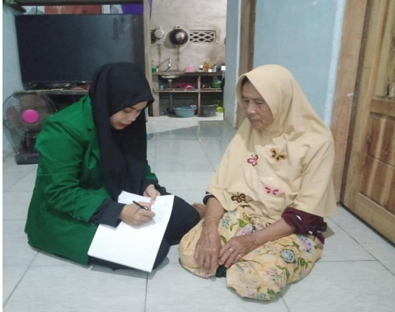
Gambar 2. Wawancara dengan Tokoh Masyarakat