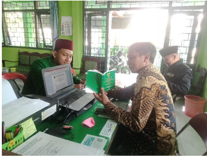
Wawancara dengan ketua pelaksana program bimbingan perkawinan