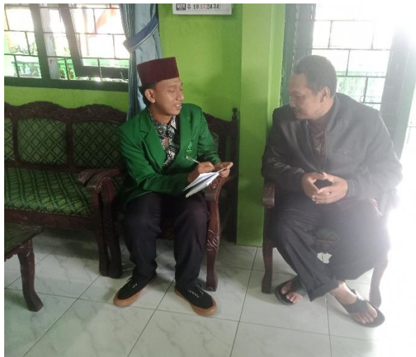
Wawancara dengan Kepala Kantor Urusan Agama Kecamatan Pesantren Kota Kediri