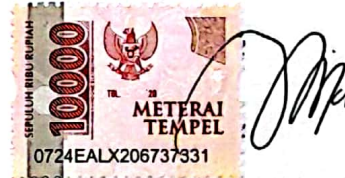
Nilam Cahya Ubaidatul Latifah