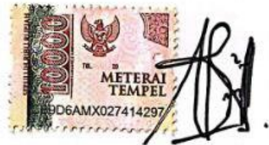
Nabila Ayu Larasati NIM. 20402137