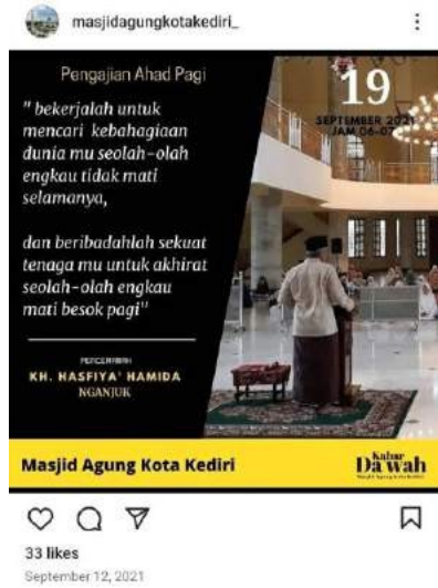
Gambar 4.4 Flyer Pengajian Ahad Pagi