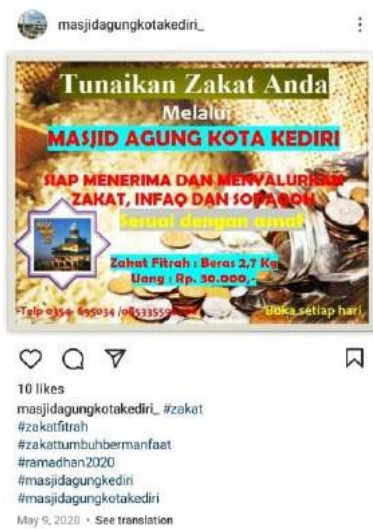
Gambar 4.3 Flyer Sosialisasi Penerimaan dan Pengumpulan ZIS