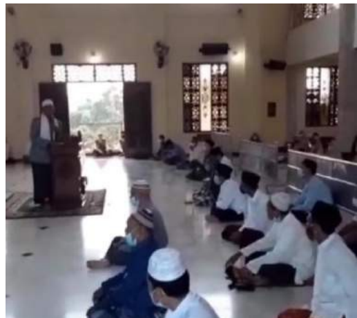
Gambar 4.1 Pengajian Ahad Pagi