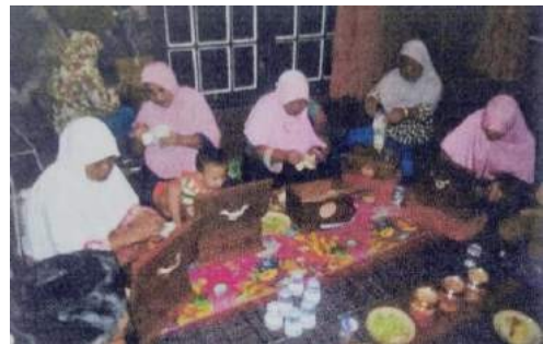
Gambar 4.5 Kegiatan Anjingsana dengan Para Mustahiq