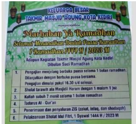
Gambar 4.2 Banner Takmir Masjid terkait kegiatan di bulan Ramadhan