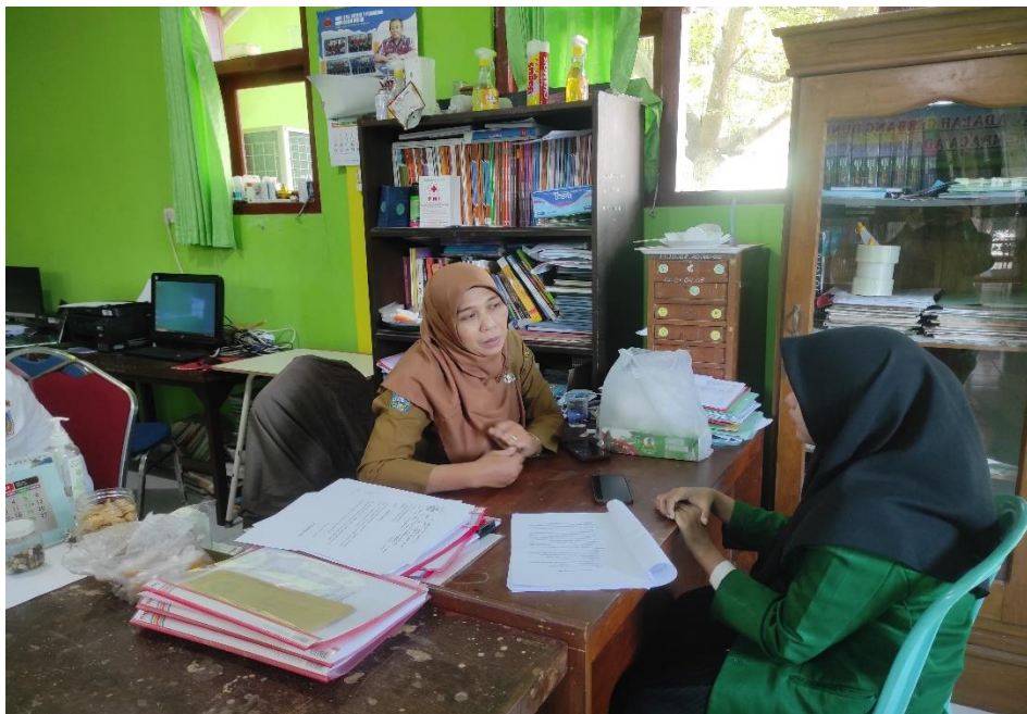
Wawancara dengan Bendahara SMAN 1 Plemahan