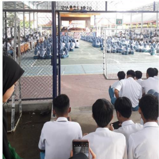
Kegiatan siswa siswi SMAN 1 Plemahan