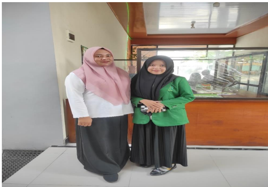
Wawancara dengan Waka Kesiswaan SMAN 1 Plemahan