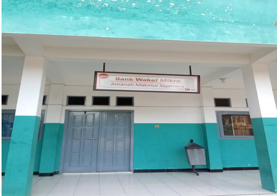
Kantor Bank Wakaf Mikro Amanah Makmur Sejahtera