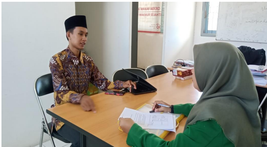
Melakukan Wawancara dengan Supervisor Bank Wakaf Mikro Amanah Makmur Sejahtera