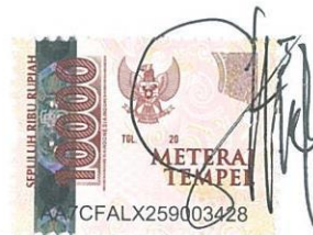
Siti Nur Azizah NIM. 20201070