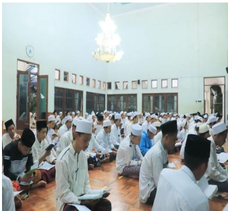
Pembiasaan Membaca Tahlil Bersama di Pondok Pesantren Al-Amien.