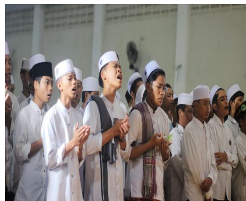
Pembiasaan Membaca manaqib Bersama di Pondok Pesantren Al-Amien.