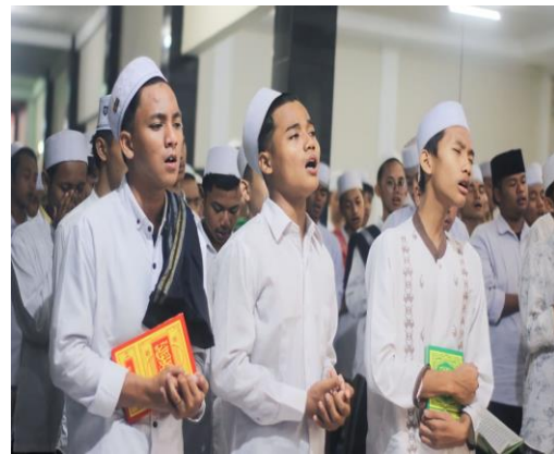
Pembiasaan Membaca manaqib Bersama di Pondok Pesantren Al-Amien.