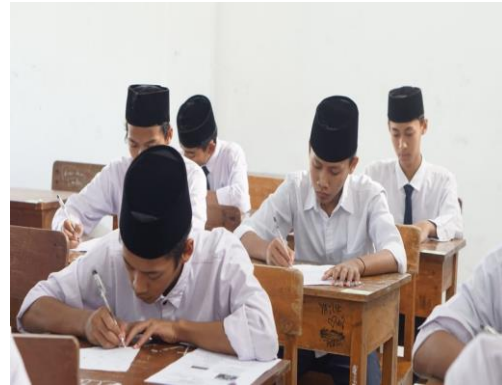
Kegiatan Pembelajaran di Madrasah Diniyah Pondok Pesantren Al-Amien.