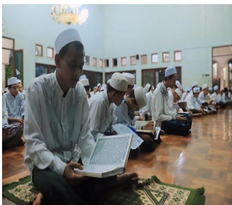
Pembiasaan Membaca Istiqhosah Bersama di Pondok Pesantren Al-Amien.