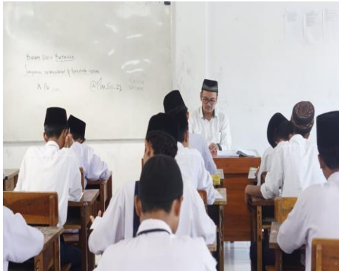
Kegiatan Pembelajaran di Madrasah Diniyah Pondok Pesantren Al-Amien.