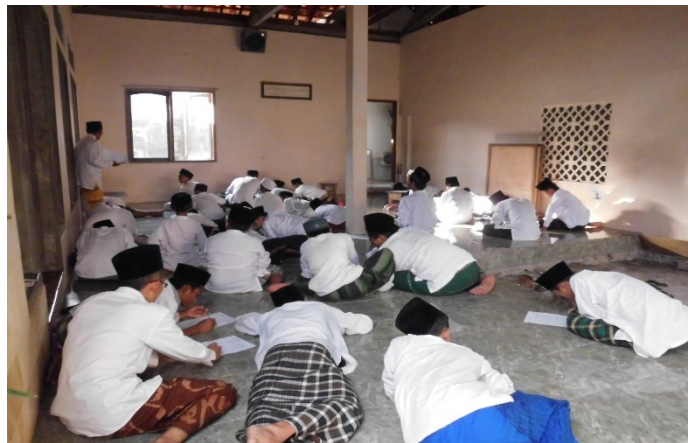
Santri Sedang melaksanakan Tes Tulis