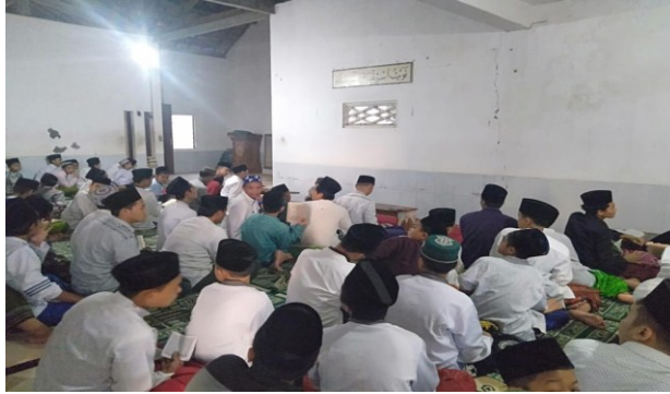
Foto Kegiatan mengaji pagi hari