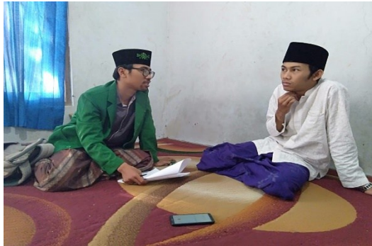
Foto Wawancara dengan Ketua Pondok PPMQ