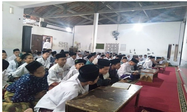
Foto Santri sedang Muroja'ah Qur'an