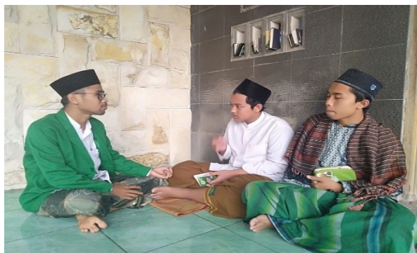
Foto Wawancara dengan Santri PPMQ