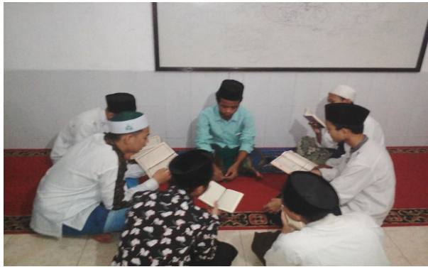
Foto santri Semaan Qur'an