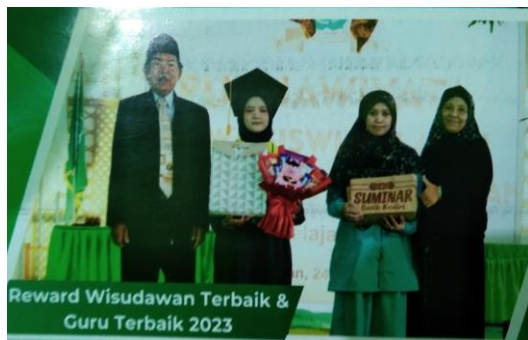
Reward guru terbaik