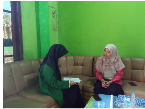
Wawancara dengan guru kelas