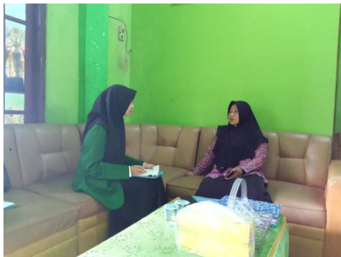
Wawancara dengan kepala sekolah