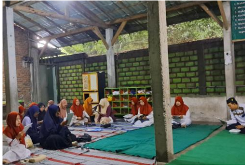
Khataman Al Qur'an