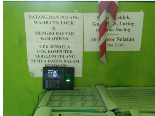
Check lock dan absensi