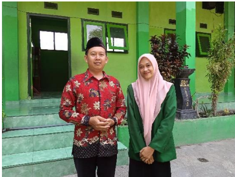
Foto bersama narasumber