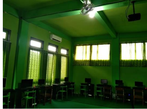
Foto prasarana SDI Modern NU Plemahan